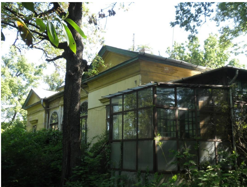
főhomlokzat rekonstrukció előtt

Födémbe épített geotermikus fűtés-hűtés létesült. A főbb használati egységekben kompakt hővisszanyerős légkezelés működik.