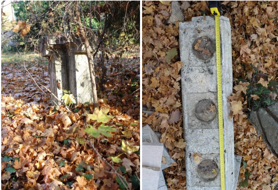
balusztrád megtalált elemei