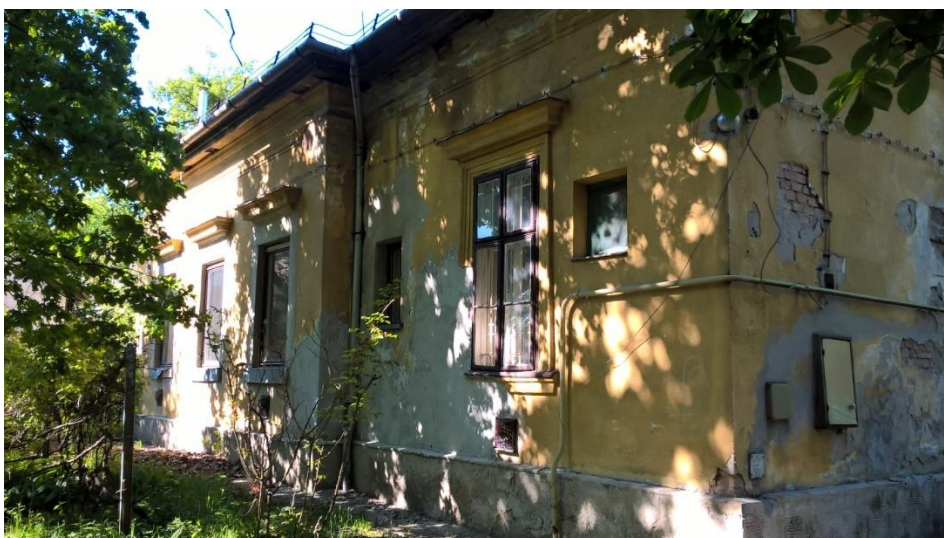
utcai homlokzat rekonstrukció előtt